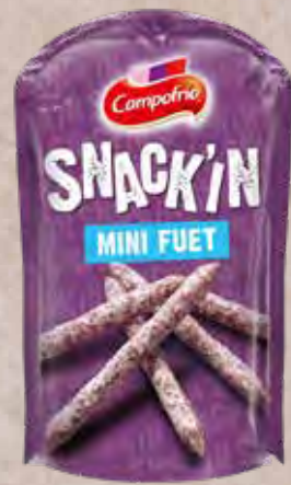
Mini fuet + picos Mini fuet + breadsticks 3,00€