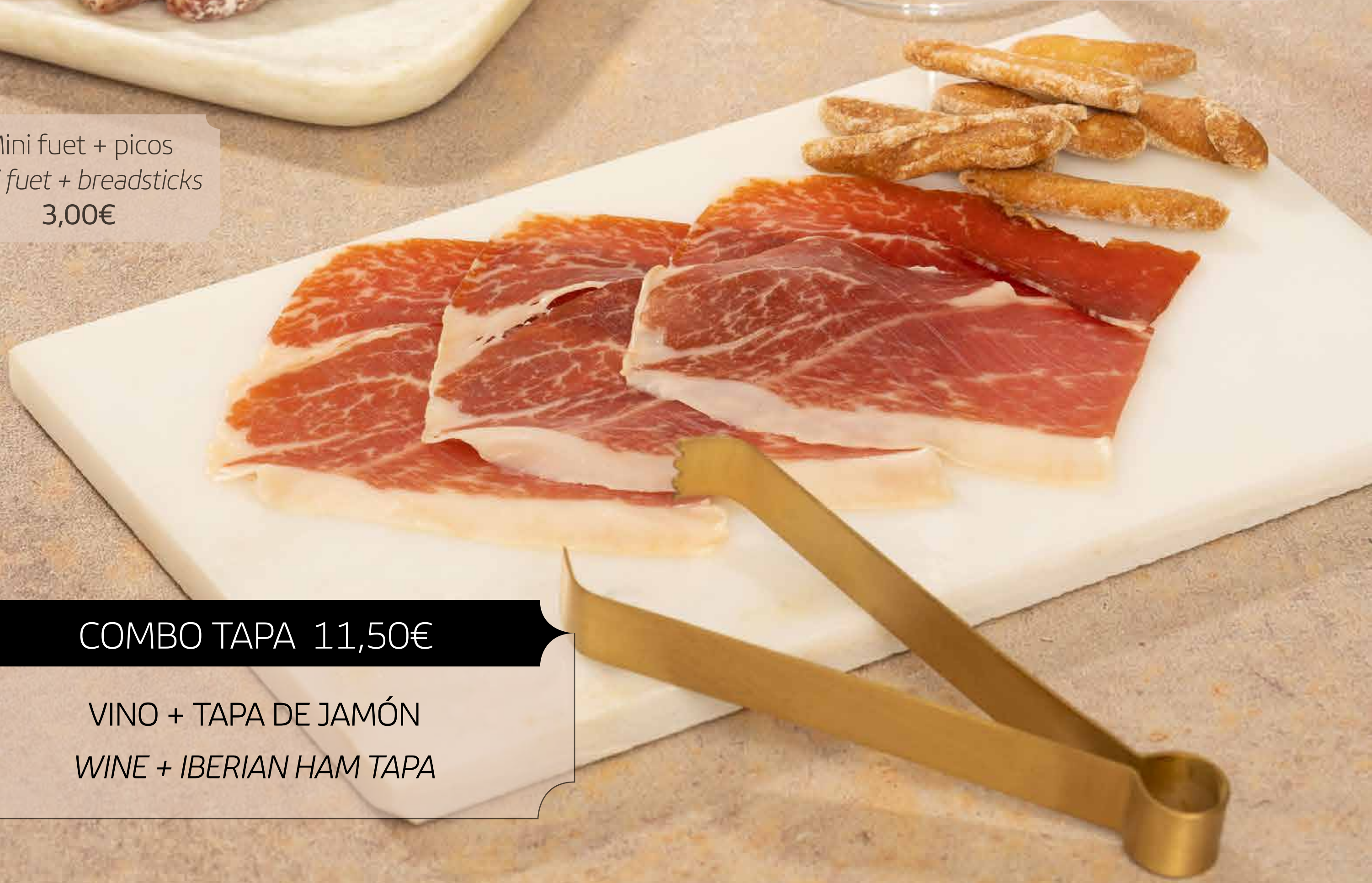
Tapa de jamón Ibérico + picos Iberian ham tapa + breadsticks 6,50€