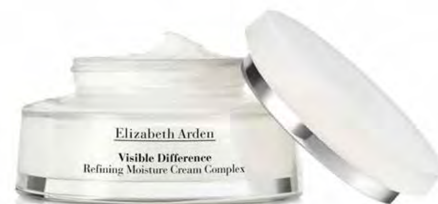
Elizabeth Arden Visible Difference. 100ml 19,90€