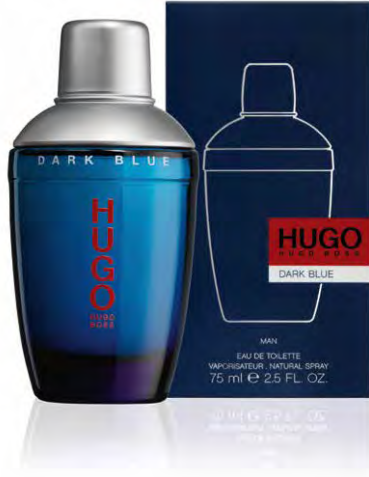
Hugo Boss. Dark Blue 75ml Eau de toilette 29,90€