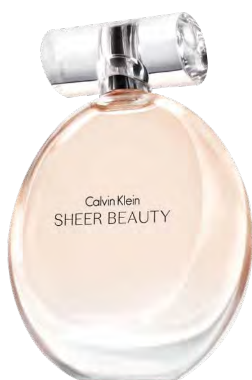
Calvin Klein. Sheer Beauty 50ml Eau de toilette 19,90€