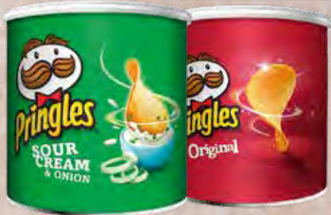
Pringles Original Sour Cream & Onion 2,50€