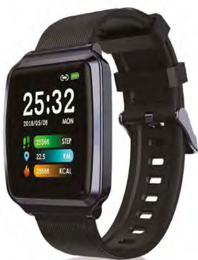
Reloj inteligente Neckmarine Neckmarine Smartwatch 48,90€