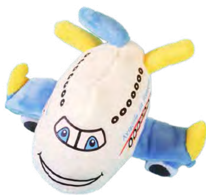
Avión de peluche solidario Solidarity soft toy plane* 8,00€