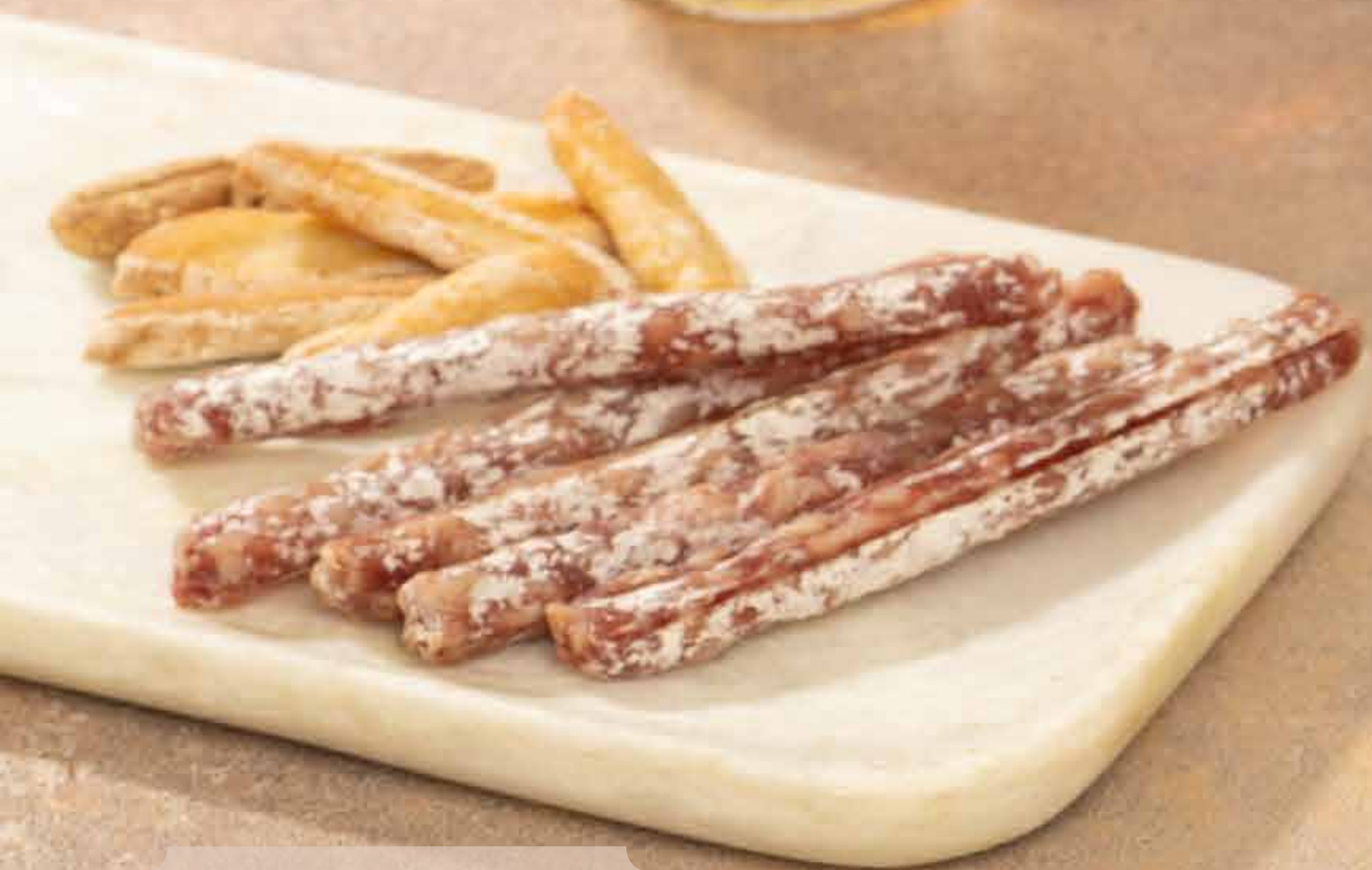
Mini fuet + picos Mini fuet + breadsticks 3,00€