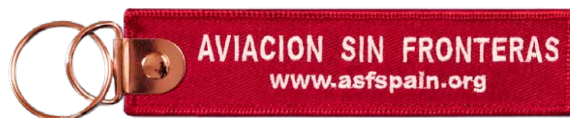
Llavero solidario Solidarity Keyring* 5,00€